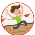
Illustration : mohamed Hassan (Pixabay).

Apprendre à lire et à écrire le français avec l'alfonic Pour un apprentissage plus logique et plus décontracté. • Je parle donc j'écris ! © www.alfonic.org